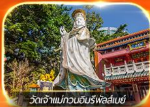
วัดเจ้าแม่กวนอิมรพัสสมัย

รวมตั๋วดิสนีย์แลนด์+รถรับ-ส่ง ซอบบิ้งแบบจัดเต็ม พักย่านจิมซาจุ่ย นั่งรถราง PEAK TRAM, ชมวิวอ่าววิคตอเรีย, วัดหลิมฟ้า, วัดหวังต้าเซียน, วัดกวนไท, วัดอองซ่า, วัดแชกงหมิว