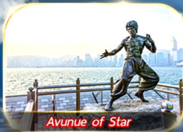
Avuene of Star