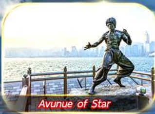
Avunue of Star