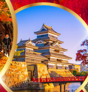
ปราสาทมัตสึโมโตะ