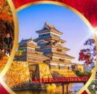
ปราสาทมัตสึโมโตะ