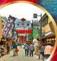
ย่านโบราณ ชิชะมาตะ