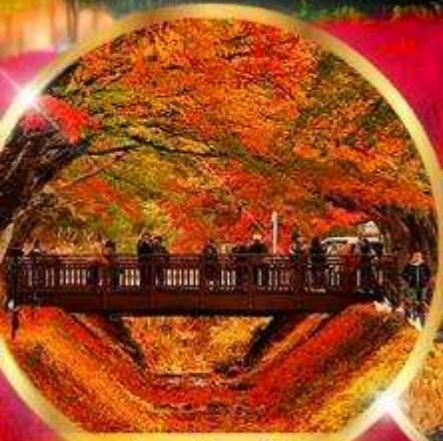
อุโมงค์เมเปิ้ล