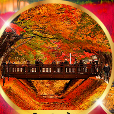
อุโมงค์เมเปิ้ล