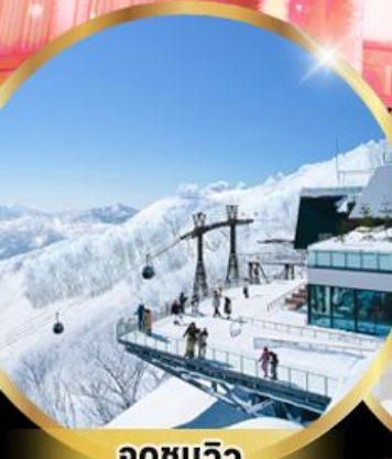
จุดชมวิว Unkai Terrace