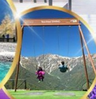
ชิงช้า Yoo hoo! Swing