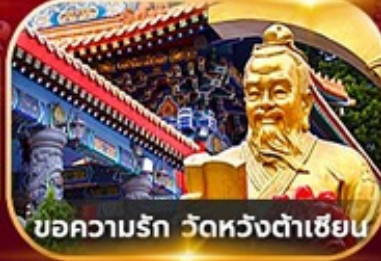
ขอความรัก วัดหวังต้าเซียน