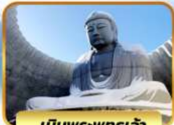
เนินพระพุทธรเจ้า