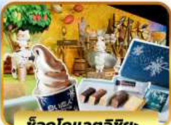
ชีอิกโกแลตอิชียะ