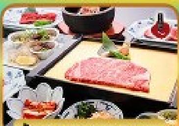
บั้งย่าง ROKKASEN