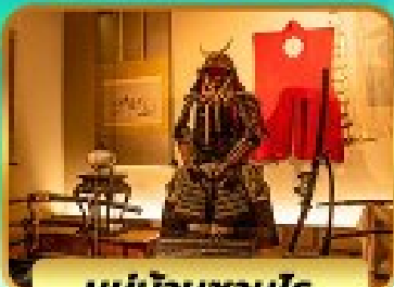
หมู่บ้านซามูไร