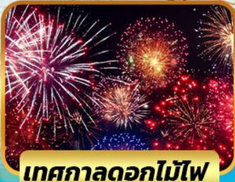
เทศกาลดอกไม้ไฟ