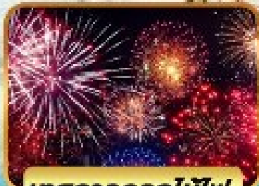
เทศกาลดอกไม้ไฟ