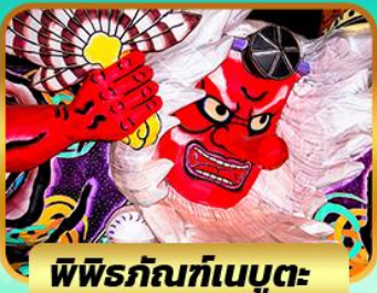
พิธีร้กัณฑ์เมบูตะ