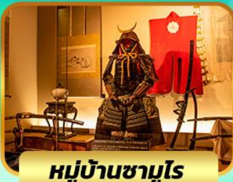
หมู่บ้านซามูไร