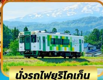
นั่งรถไฟยูริโคเกิน