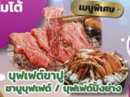
เมนูพิเศษ บุฟเฟ่ต์ซาซิมิ / บุฟเฟ่ต์บิงชัง