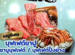
เมนูพิเศษ บุฟเฟ่ต์ข้าว ซาซิมิบุฟเฟ่ต์ / บุฟเฟ่ต์บิงชัง