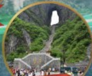
กำแพงมรกต