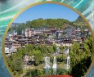
เมืองโบราณฟูหลงเจิน