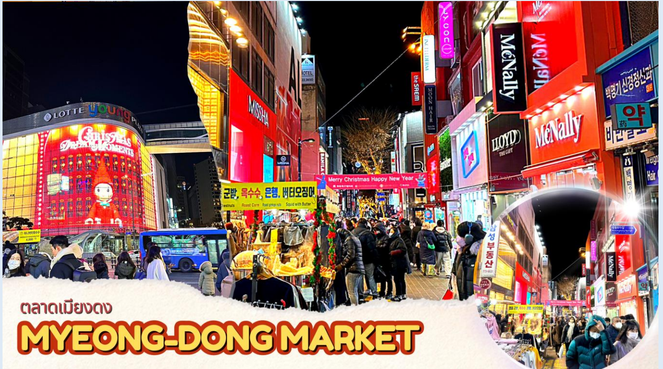
ตลาดเมียงดง MYEONG-DONG MARKET

จากนั้นนำท่านช้อปปิ้งย่าน เมียงดง หรือสยามสแควร์เกาหลี หากท่านต้องการทราบว่าแพชั่นของเกาหลีเป็นอย่างไร ก้าวล้ำนำสมัยเพียงใดท่านจะต้องมาที่เมียงดงแห่งนี้ พบกับสินค้าวัยรุ่น อาทิ เสื้อผ้าแฟชั่นแบบอินเทรนด์ เครื่องสำอางต่าง ๆ ของเกาหลี พบกับความแปลกใหม่ในการช้อปปิ้งอีกรูปแบบหนึ่ง ซึ่งเมียงดงแห่งนี้จะมีวัยรุ่นหนุ่มสาวชาวโสมไปรวมตัวกันที่นี้กว่าล้านคนในแต่ละวัน