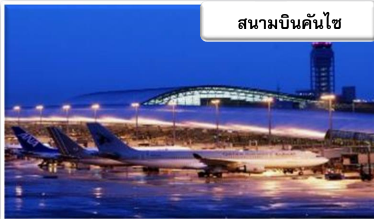
สนามบินคันไซ

เวลา 00.25 น. ออกเดินทางสู่ สนามบินคันไซ ประเทศญี่ปุ่น โดยสายการบินเจแปนแอร์ไลน์ เที่ยวบินที่ JL 728