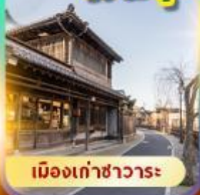
เมืองเก่าซาวาระ