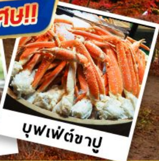
บุฟเฟ่ต์ซาบู