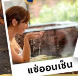
แ่ฮ้ออนเซ็น