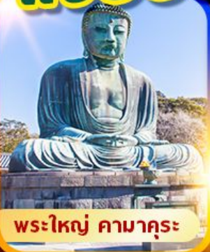
พระใหญ่ คามาคุระ