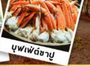
บุฟเฟต์ชาบู