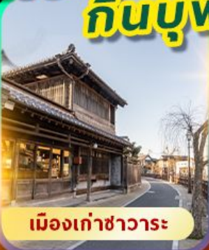
เมืองเก่าซาวาระ