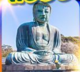
พระใหญ่ คามาคุระ