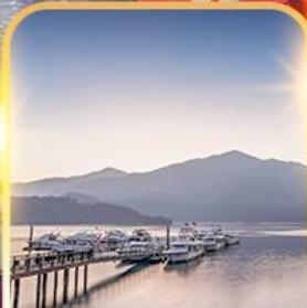
ทะเลสาบสุริยันจันทรา