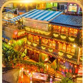
หมู่บ้านจิวเฟิน