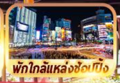
พักใกล้แหล่งช้อปปิ้ง