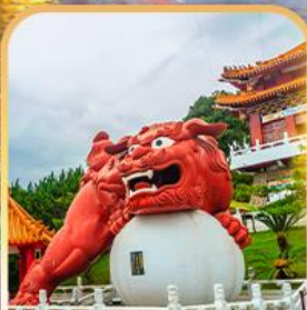
วัดเหวินหฺวู่