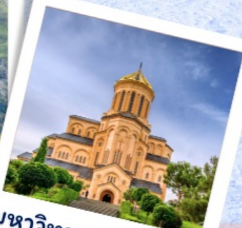
มหาวิหารแห่งทบิลีซี