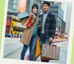
Free time Shopping