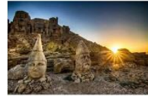
ชมพระอาทิตย์ขึ้น