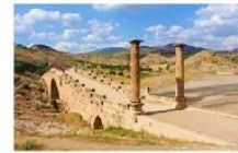
สะพานเซเวอร์ริน

19.20 น. เห็นฟ้าสูนครอิสตันบูล โดยเที่ยวบิน TK 2215