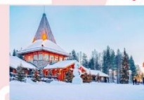
หมู่บ้านซานต้าครอส

15.25 น. ออกเดินทางสู่อิสตันบูล ประเทศตุรกี เที่ยวบินที่ TK 1750 21.10 น. เดินทางถึงสนามบินอิสตันบูล (แวะเปลี่ยนเครื่อง)