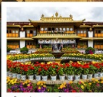
ตำหนักนอร์บูหลินมา

ชมวิวยอดเขานานเจียปาหว่า / จุดชมวิวกะเลปาหลูกลาง / อุทยานเข่าเปิ่นยี่ / ระเบียบกระจก / วัดลามะ พระราชวังโปตาลา / วัดโจคัง / ถนนแปดเหลี่ยม / ทะเลสาบน้ำมูเซว / ตำหนักนอร์บูหลินมา / เมืองโบราณลั่วใต้