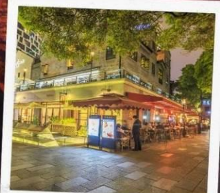
ย่านซินเทียนตี้