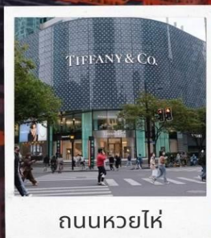
ถนนหวยไห่