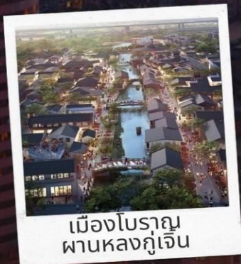
เมืองโบราณ ผานหลงกุ่เจิน