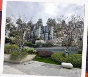
Tian An 1,000 Trees Square