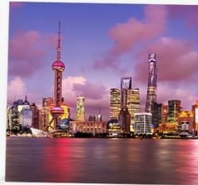
ชั้นหอไข่มุก