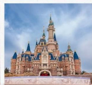
ดิสนีย์แลนด์