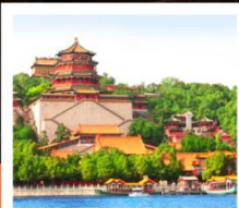
อวิ๋หลอหววน