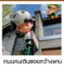
ถนนคนเดินฮวงหลง