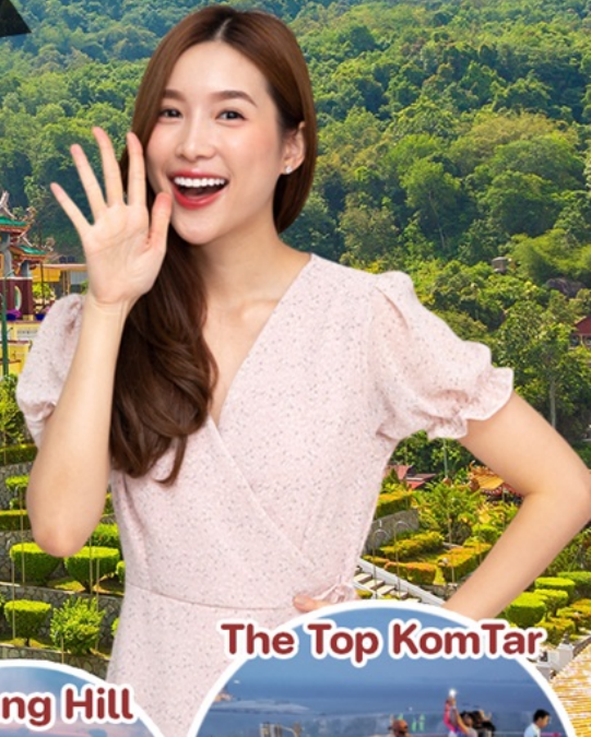
The Top KomTar