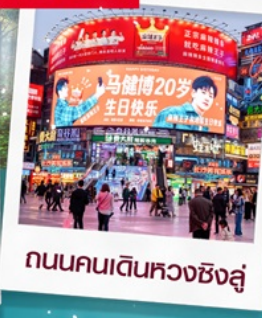
ถนนคนเดินหวงซิงสู๋