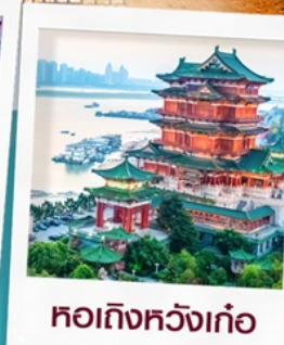
หอถึงหวังเก๋อ