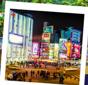
ช้อปปิ้งซีเหมินติง