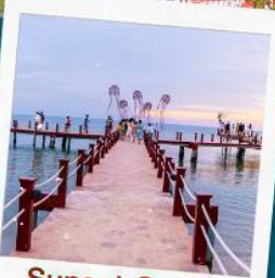
Sunset Sanato Beach Club