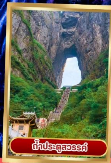
ถ้ำประตูสวรรค์