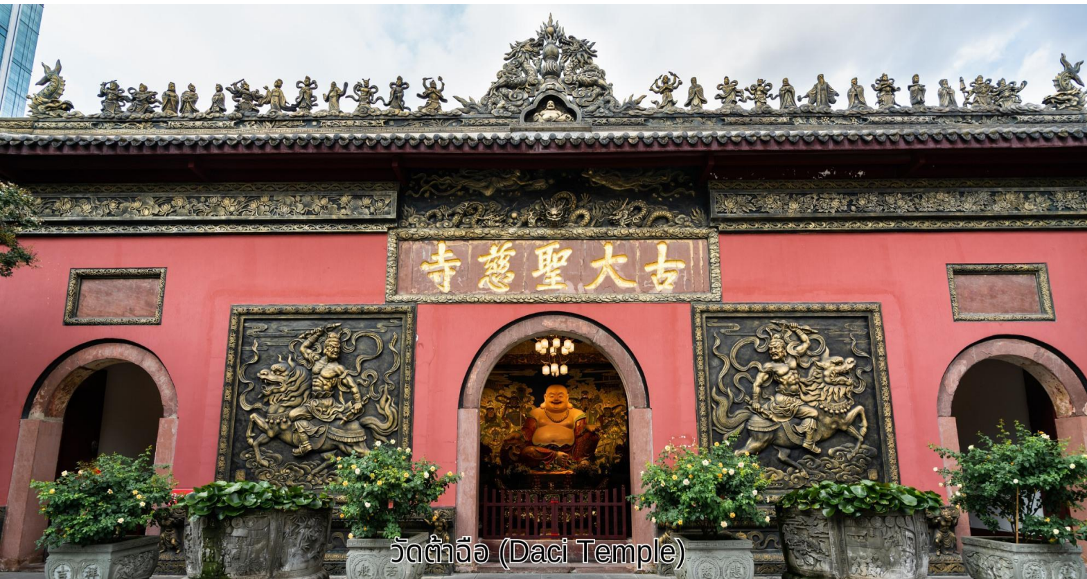
วัดต้าจื่อ (Daci Temple)

เช้า บริการอาหารเช้า ณ ห้องอาหารของโรงแรม