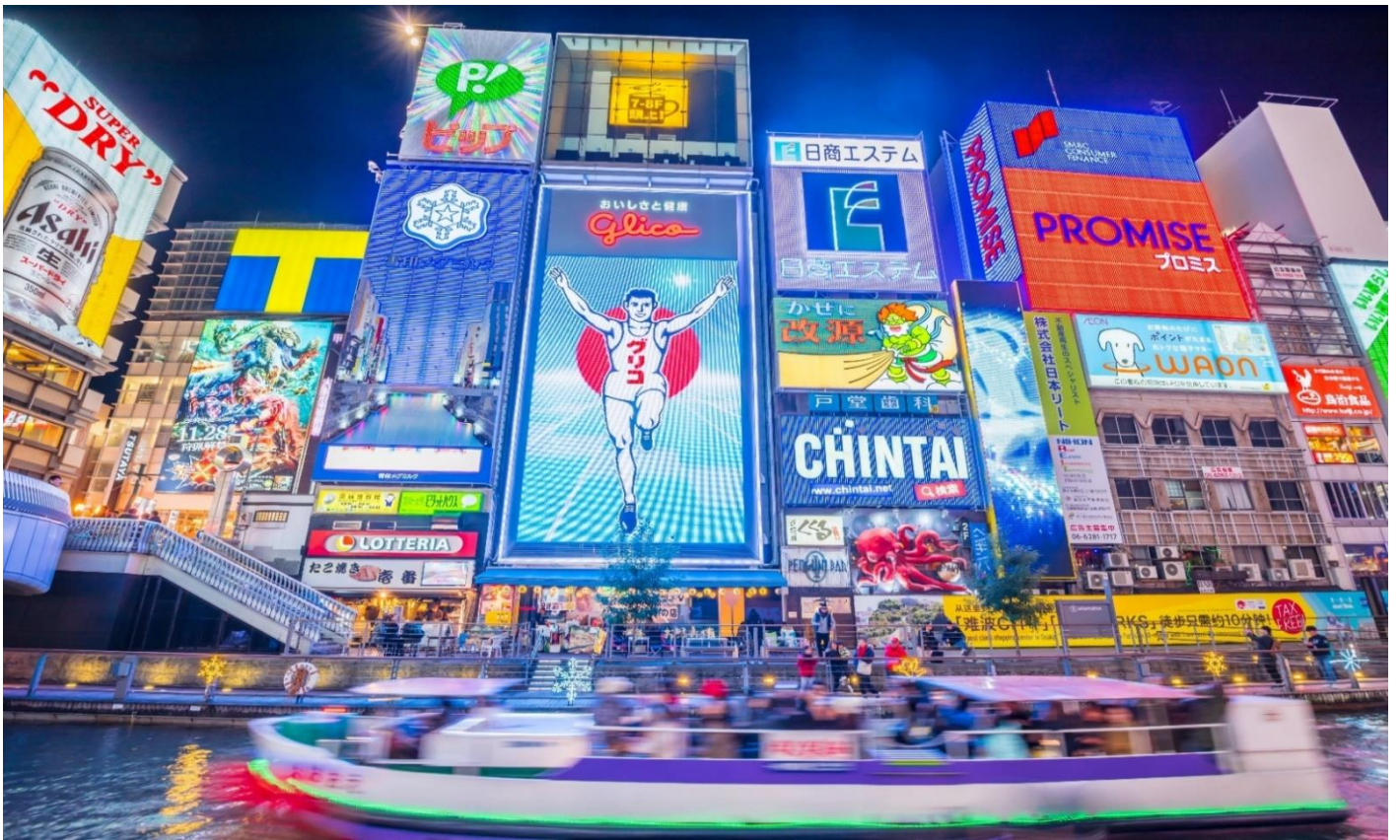
คำ อีระอาหารตามอัยาศัยเพื่อสะดวกแกการช้อปปั้ง ที่พัค SUN WHITE HOTEL, OSAKA หรือเทียบเท่า