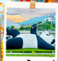
แพนด้าเซลฟ์