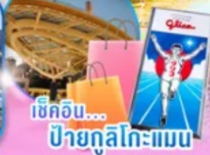
เช็กอิน... ป้ายกูลิโกะแมน

ไฮไลท์!! สัมผัสวัฒนธรรมเมืองอูจิ แหล่งปลูก "ชาเขียวอูจิ" ที่ดีที่สุดในโลก วัดเมียวไดอิน แห่งอูจิเป็นมรดกโลกที่มีประวัติยาวนานหนึ่งพันปี ชม หมู่บ้านมรดกโลกการันตีโดย UNESCO ณ หมู่บ้านชิราคาวาโกะ ช้อปปิ้งจุใจ ย่านซากาเอะ ย่านชินโซบาชิจิ ป้ายกูลิโกะแมน แห่งโดทงโบริ