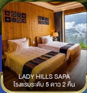
LADY HILLS SAPA โรงแรมระดับ 5 ดาว 2 คืน