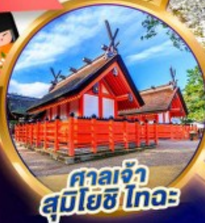
ศาลเจ้า สุมิโยชิ โทงะ