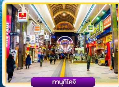
ทานุกิโคจิ