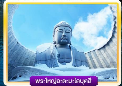
พระใหญ่อะตะมะโดบุตสึ