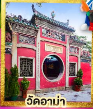
วัดอาบ่า