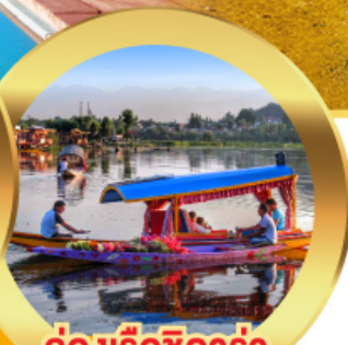
ล่องเรือซิคาร์่า