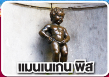
แมนเนเกน ฟิส

ฝรั่งเศส เบลเยียม ลักเซมเบิร์ก เยอรมนี เนเธอร์แลนด์ 8 วัน 5 คืน