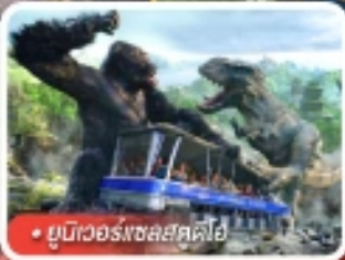
ยูนิเวอร์สอลสตูดิโอ