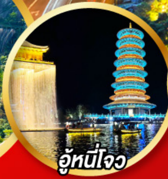
อู่หนีโจว