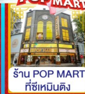
ร้าน POP MART ที่ซีเหมินติง