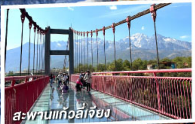
สะพานแก้วลี่เจียง