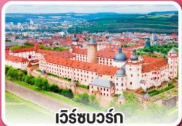
เว็ร์ชบวร์ค