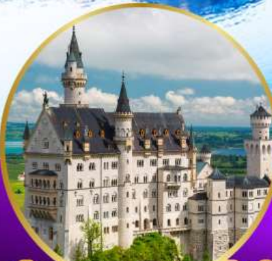
ปราสาทนอยชวานสไตน์