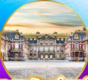
พระราชวังแวร์ซายส์