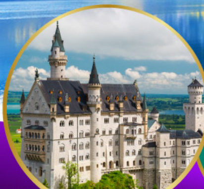
ปราสาทนอยชวานสไตน์