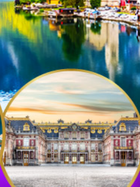
พระราชวังแวร์ซายส์