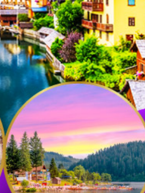
ททิเซ่ ปาดำ