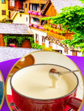
ฟองดูซีส