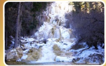
อุทยานหมอกหนึโกว