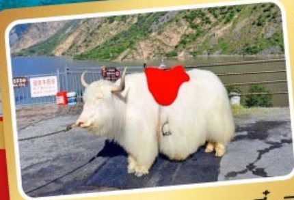
จามริทะเลสาบเตี้ยซี