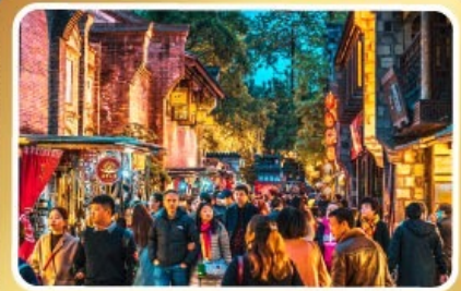
ถนนโบราณชอยกวางชอยแคบ