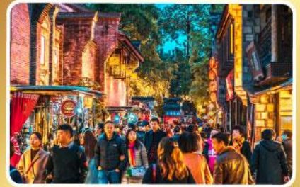
ถนนโบราณชอยกวางชอยแคบ

โหมวหนี่โกว ภูเขาหิมะ-การะเซียต้ากู่ปิงชวน