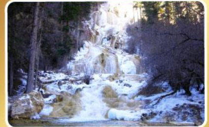
อุทยานโหมวหนี่โกว