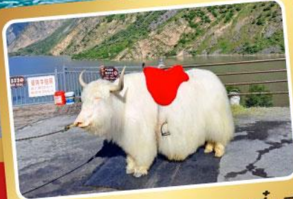
จามรึกะเลสาบเตี้ยซี