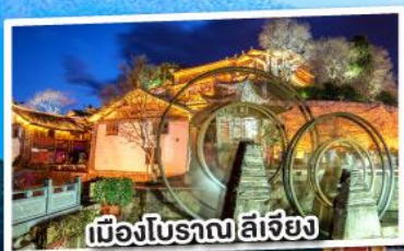
เมืองโบราณ ลี่เจียง