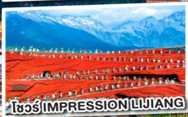
โชว์ IMPRESSION LIJIANG