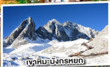
เขาสหิมะมังกรหยก