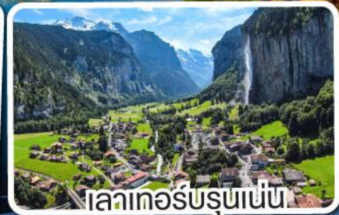
ลาเทอรับรุเนน