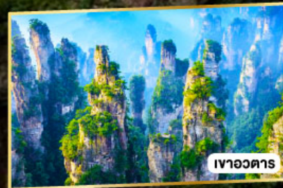
เวาอวดาร