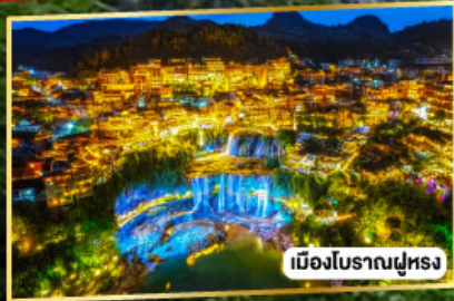
เมืองโบราณฝูหลง

เฟิ่งหวง ฝูหลงเจิน มนตร์งลิ่งแห่งขุนเขา และเมืองโบราณ 5 วัน 4 คืน