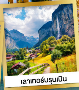
เลาเทอร์บรุนเนิน